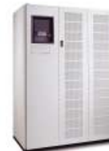
40 kVA–625 kVA

Optionen: Hot Sync-drahtlose Parallelverarbeitung, galvanische Isolation (Standard bis 160 kVA, optional höher), Fernmeldung, Fernüberwachungsanzeige, zusätzliche Eingangsfiler