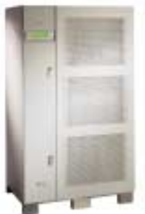
80 kVA–130 kVA

Optionen: Trenntransformator, externe Handumgehung, Batterien mit 10-jähriger Lebenserwartung, Fernüberwachungsanzeige, externe Batterieeinheiten