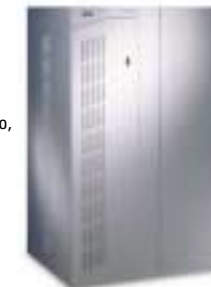
7,5 kVA–80 kVA

Optionen: Trenntransformator, Eingangsfiler, zusätzliche Batterieeinheiten, Batterien mit 10-jähriger Lebenserwartung, ViewUPS