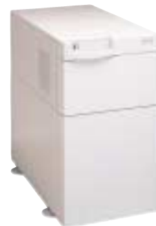
8 kVA–15 kVA

Optionen: Trenntransformator, Eingangsfiler, zusätzliche Batterieeinheiten, Batterien mit 10-jähriger Lebenserwartung, ViewUPS