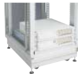
1000 VA–3000 VA

Optionen: Trenntransformator, Eingangsfiler, zusätzliche Batterieeinheiten, Batterien mit 10-jähriger Lebenserwartung, ViewUPS