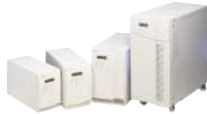
700 VA–6000 VA

Optionen: Trenntransformatoren, zusätzliche Batterieeinheiten, externe Handumgehung