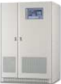
10 kVA – 250 kVA

Optionen: 12-Puls-Gleichrichter, galvanische Trennung, Parallelbetrieb von bis zu 8 Systemen, Fernüberwachung / -bedienung bis 400 m, Eingangsfiler gemäß G5/3, Aufbauschränke bis Schutzart IP54