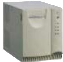
500 VA–1400 VA