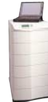
3 kVA–18 kVA

Optionen: SNMP/Web-Adapter, externe Handumgehung, externe Batterieeinheiten, Rackmountkit für 3-6 Slots