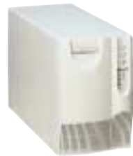
1000 VA–2200 VA

Optionen: ConnectUPS SNMP-Adapter, PowerPlexer™-Karte, MultiUPS™ Karte, Externe Batterieoptionen