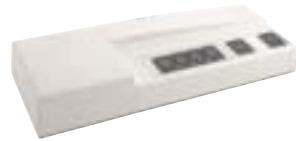
300 VA–700 VA