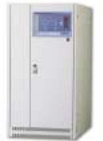
10 kVA – 25 kVA

Hot-Standby, galvanische Trennung des Gleichrichters, Eingangsfiler gemäß G5/3, Fernüberwachungskonsole, Starklader für Nickel-Cadmium-Batterien